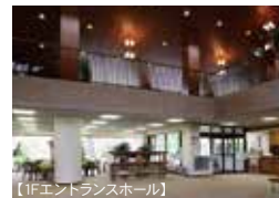
【1Fエントランスホール】

詳しくは、会員募集事務局 TEL.026-266-2011までお問い合わせください。